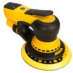
MIRKA DEROS 5650 CV