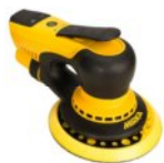
MIRKA DEROS 5650 CV